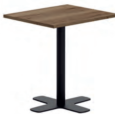
T Spinner HA ht75 76 ep79 HA85