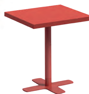
T Spinner-Q HPL ht75 77 ep39 HP39