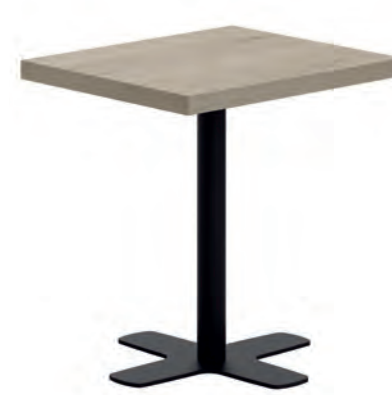
T Spinner-Q HA ht75 76 EP79 HA83