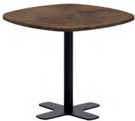
T Spinner HPL ht75 90C ep79 HP73

Optional: T Spinner set 4 adjustable glides