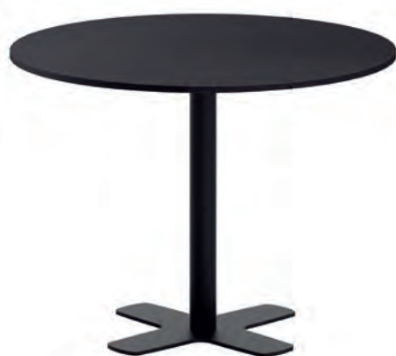
T Spinner FE ht75 100 ep79 HF00